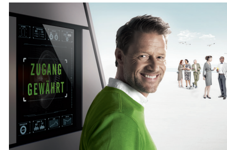
Zugang zu verbessertem Hörerlebnis

bung anzupassen. „So erlebt der Hörgeräteträger außergewöhnliche Hörleistung und Klangqualität – egal in welcher Hörsituation sich die Person gerade befindet“, weiß der Experte fürs Hören, Vorname Name.