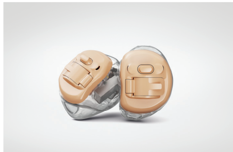
Innovative Hörlösungen für ein neues Lebensgefühl

Jeder Mensch ist einmalig und jedes Ohr ist so individuell wie Ihr Fingerabdruck. Es gibt sogar Unterschiede zwischen dem rechten und dem linken Ohr. Die einzigartigen Merkmale der Anatomie unserer Ohren beeinflussen die Art und Weise wie Klänge erfasst, zum Trommelfell weitergeleitet