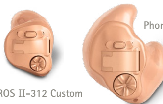
Phonak CROS II-312 Custom

Alternativ sind zudem zwei CROS II Im-Ohr Modelle, die im Gehörgang getragen werden, verfügbar.