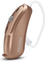
Amber Beige (P2)