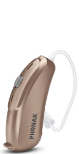
Sand Beige (P1)