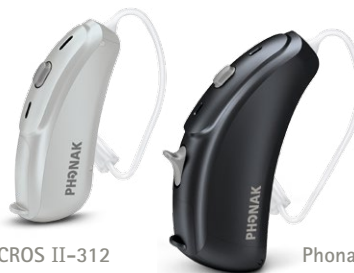
Phonak CROS II-312

Das 13er Modell ist etwas größer und bietet zusätzlich eine längere Batterielaufzeit und einen Lautstärkesteller.