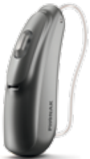
Naída B-R RIC