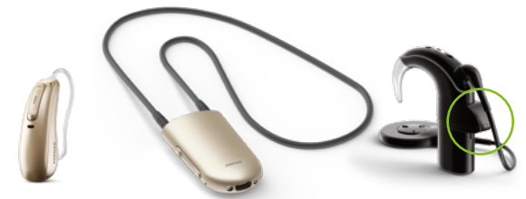
Audífono con RogerDirect

En los audífonos con RogerDirect™, el receptor puede integrarse directamente. No necesita añadir un receptor externo. Para otros audífonos e implantes, existen varios tipos de receptores disponibles.