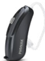
Velours Noir (P8)