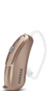
Dune de Sable (P1)

Choisissez parmi 11 couleurs pour assortir l'aide auditive à la couleur de votre peau ou de vos cheveux.