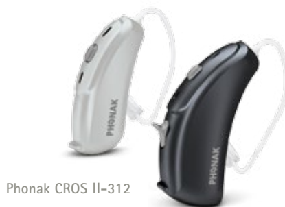
Phonak CROS II-312

Pour votre meilleure oreille, vous pouvez associer le CROS II à n'importe quelle aide auditive Phonak Venture.