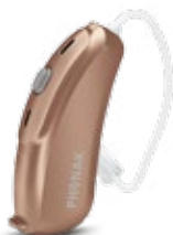
Beige Ambré (P2)