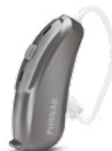
Gris Carbone (P7)