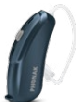
Bleu Pétrole (Q1)