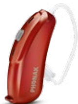
Rouge Rubis (P9)