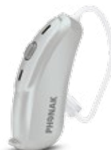
Gris Argenté (P6)