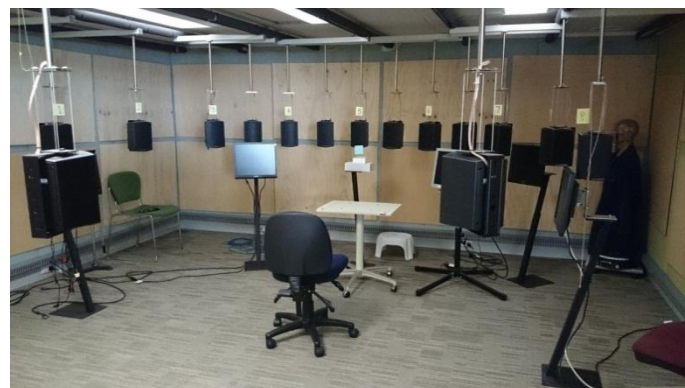
図 2 測定環境

ンの目標利得に合わせました。全てのテスト環境において、ロジャー ペンをワイヤレスマイクロホンとして使用しました。臨床準備検査室で行った語音聴取閾値（50%正答率）の測定には、Bamford Kowal Bench（以下、BKB）と類似した文章が使用されました。これは BKB よりも文章リストが多いので同じ文章を 2 回提示する必要があります。文章リストはオーストラリア人女性によって読まれました。騒音は被験者の前方に扇形に並んだ 12 個のスピーカーから提示され、文章は 0 度位置から 65 dB SPL で提示しました（聞き手は目の前）。騒音にはオーストラリア人の男性女性を含めた 12 名の話者で作成したマルチトーカーノイズを使用しました。テスト中、スピーチレベルは固定、騒音レベルは調整可能にしました。鉛直、水平、手持ちとマイクロホンを適宜設置し、3 つのマイクロホンモードとオートマッチモードでロジャー ペンを測定しました。（図 2 は測定環境、表 2 は測定状態）