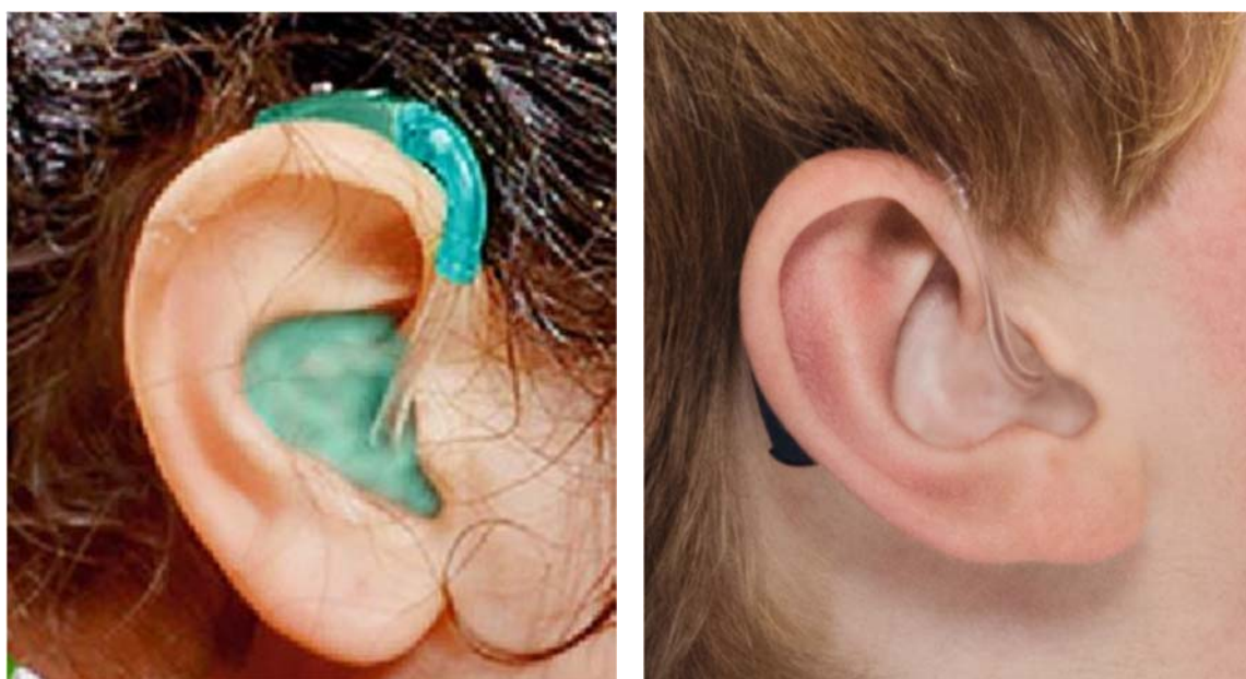
Рис. 8: Традиционные рожок и звуковод (слева); звуковод SlimTube (справа).

С тонкими звуководами можно использовать различные стандартные и индивидуальные вкладыши. Стандартные варианты представляют собой сменные открытые, закрытые и мощные вкладыши-купола.