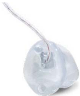
Рис. 10: Индивидуальный корпус cShell с закрытой лицевой панелью и внутриканальным ресивером.