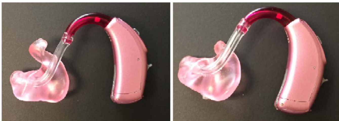
Рис. 2а: Вкладыш "полная раковина" с завитковым замком (слева) и без него (справа).

возраста, однако по мере его взросления необходимо оптимизировать акустические свойства вкладышей. Если при замене вкладыша появилась обратная связь, аудиолог должен попробовать изготовить более глубокий вкладыш, доходящий до костного отдела слухового прохода, активировать систему подавления обратной связи или пересмотреть подход к использованию вента.