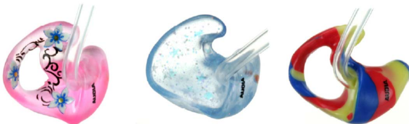
Рис. 3: Образцы разноцветных и блестящих ушных вкладышей, используемых в детской практике.

Если родителям сложно установить новый, более плотно сидящий вкладыш в ухо ребенка, можно воспользоваться смазкой, например, глицерином или OtoEase. Напротив, когда вкладыш становится мал, можно посоветовать временно использовать уплотнитель, например OtoFerm, чтобы предотвратить обратную связь. Обязательно предупредите родителей, что к таким мерам следует прибегать лишь на короткое время, т.к. длительное использование смазывающих или уплотняющих средств может привести к избыточному увлажнению уха, сопровождающемуся ростом бактерий. Членам семьи ребенка обязательно надо попрактиковаться в установке вкладышей в ухо под наблюдением аудиолога.