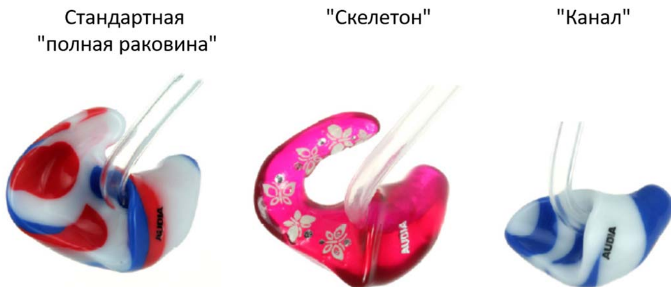
Рис. 2: Разные типы ушных вкладышей – "полная раковина", "скелетон" и "канал".

Ушные вкладыши также могут быть разными по типу, например, "полная раковина", "скелетон" или "канал" (рис. 2). Младенцам и детям младшего возраста больше всего подходит полная раковина с завитковым замком, хорошо удерживающим вкладыш в маленьком ухе. На рис 2а представлены образцы вкладышей "полная раковина" с завитковым замком и без него. Когда ребенок становится старше, он учится самостоятельно вставлять вкладыш в ухо. При этом лучше удалить завитковый замок – это облегчит введение вкладыша в ухо и сделает процедуру надевания аппарата более комфортной. Старшие дети могут предпочесть "скелетон" как косметически более привлекательный, однако мягкие "скелетоны" слишком податливы и с трудом входят в детское ухо. Вы можете заказать ушные вкладыши разных цветов, в том числе многоцветные и блестящие (рис. 3). Главное, чтобы ребенок пользовался своими вкладышами с удовольствием!