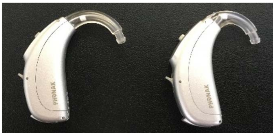
Рис. 5: Заушный слуховой аппарат со стандартным рожком HE10 680 (слева) и мини-рожкой HE10 680 (справа).

Как стандартный рожок, так и мини-рожок могут снабжаться фильтром "680", сглаживающим амплитудно-частотную характеристику. Благодаря сглаживанию пиков можно лучше настроить максимальный выходной уровень (ВУЗД) аппарата и снизить риск возникновения обратной связи (Scollie, Seewald, 2002). Важно помнить, что акустические демпфирующие элементы изготовлены из абсорбирующих волокон, способных впитать влагу или загрязниться. Пропитанный влагой фильтр может привести к более глухому звучанию или даже полному отсутствию звука, часто расцениваемому как поломка слухового аппарата. Поэтому, устанавливая причину неработоспособности аппарата, не забудьте отсоединить рожок. Все заушные слуховые аппараты Phonak совместимы с мини-рожками и блокируемыми мини-рожками. В соответствии со стандартами IEC, блокируемые принадлежности предназначены для предотвращения проглатывания мелких деталей детьми. Для разблокировки детского блокируемого рожка вам понадобится небольшой инструмент (рис. 6). Мы выпускаем рожки шести цветов (рис. 7), чтобы сделать процесс подбора и ношения слуховых аппаратов более привлекательным для ребенка. Рожки можно заменять в домашних условиях, поэтому они являются недорогим средством персонализации слуховых аппаратов.