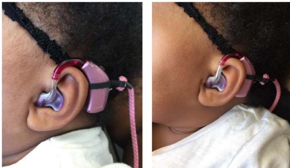
Рис. 4: Слишком свободно сидящий на ухе слуховой аппарат со стандартным рожком (слева). Тот же слуховой аппарат, снабженный мини-рожкой, исправляющим положение аппарата на ухе и обеспечивающим лучшую фиксацию и комфортность (справа).