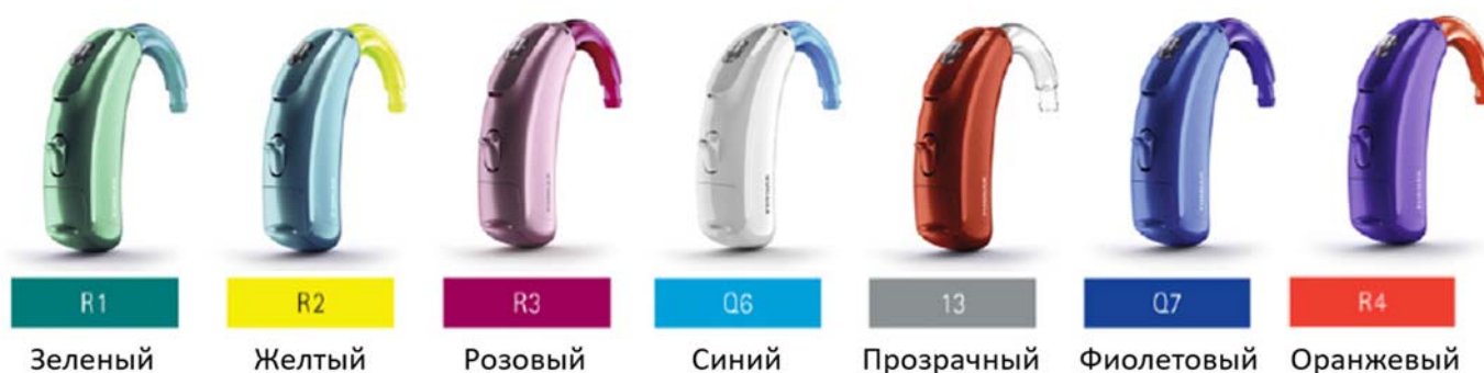
Рис. 7: Для персонализации детских слуховых аппаратов Phonak предлагает стандартные и блокируемые мини-рожки шести цветов плюс прозрачный.