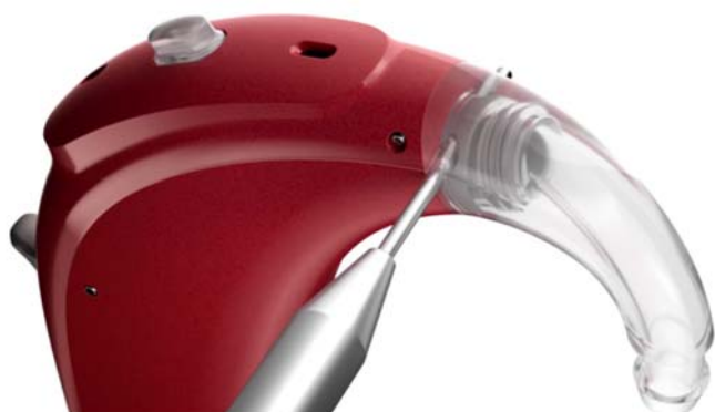
Рис. 6: Разблокировка блокируемого рожка Phonak с помощью специального инструмента.

SlimTube и 00-3 для Power SlimTube (совместимы с аппаратами Naída и Sky SP и UP). Размеры 00 и 0, как правило, подходят детям в возрасте до 7 лет. Звуководы SlimTube могут быть снабжены стандартными или индивидуальными вкладышами. Необходимо отметить, что косметическая незаметность SlimTube неизбежно приводит к ряду акустических компромиссов. Так, максимальное усиление и выход снижены на 5-10 дБ по сравнению со стандартным рожком HE10 680. Поскольку акустику звуководов SlimTube невозможно смоделировать в камере сопряжения (куплере), мы рекомендуем всегда верифицировать настройку в реальном ухе, а не посредством измерения RECD.